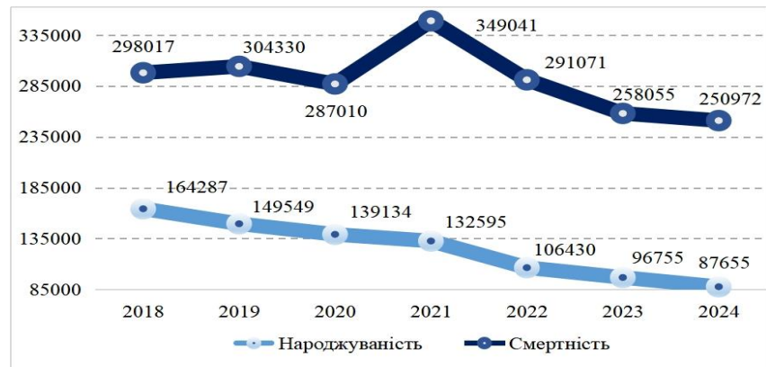
Рис. 2. Народжуваність та смертність українців протягом 2018-2024 рр. (січень-червень), кількість осіб