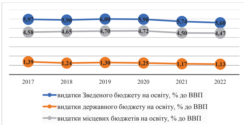
Рис. 2. Рівень видатків на освіту у % до ВВП у 2017-2022 рр.