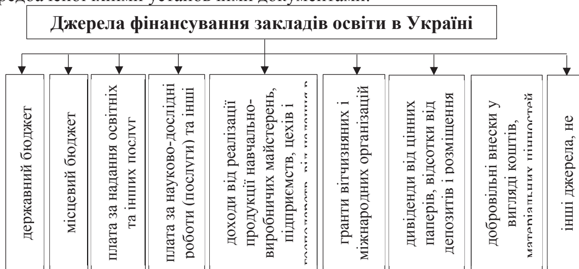
Рис. 1. Джерела фінансування освіти в Україні

Джерела, за рахунок яких забезпечується фінансування освіти, відображені на рис. 1. Заклади освіти самостійно розпоряджаються надходженнями від провадження господарської та іншої діяльності, передбаченої їхніми установчими документами.