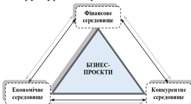
Рис. 1. Місце бізнес-проєктів у розвитку економіки країни

На рис. 1 відображено загальне місцерозташування бізнес-проєктів щодо забезпечення підтримки та розвитку країни в умовах війни в поєднанні із найважливішими її структурними фінансово-економічними елементами.