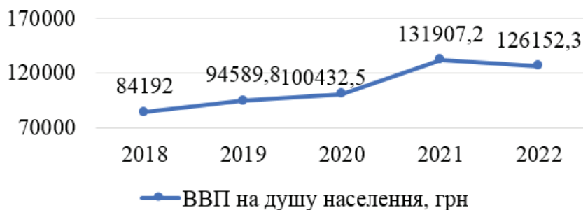
Рис. 1. Номінальний ВВП України з 2018 по 2022 рр. з розрахунку на одну особу населення

Проаналізуємо основні макроекономічні показники на прикладі ВВП на душу населення, індексу споживчих цін (ІСЦ) і державного боргу, щоб визначити зміни в умовах проведення фінансової політики (рисунки 1,2 і 3).