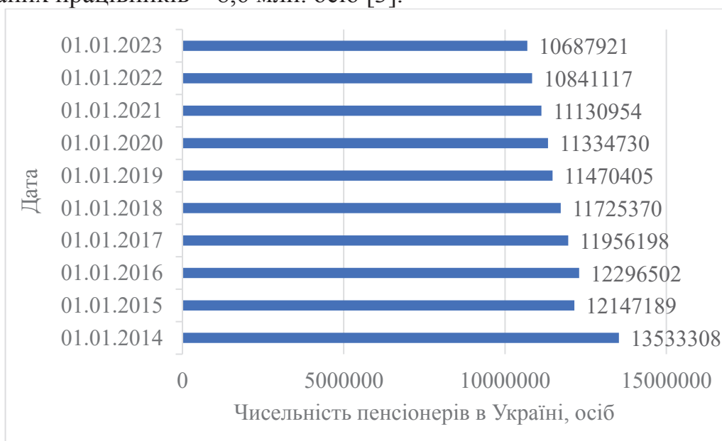
Рис. 1. Динаміка кількості пенсіонерів в Україні з початку російської агресії проти української держави (2014-2023рр.)

Станом на 1 січня 2023 року на обліку в Пенсійному фонді України перебувало 10,69 млн. осіб пенсіонерів, що на 153,2 тис. осіб менше порівняно із початком 2022 року (рис.1). Як свідчать дані, наведені у звіті про роботу Пенсійного фонду у 2022 році, із загальної чисельності пенсіонерів отримують пенсії 6,5 млн. жінок (60,8%) та 4,19 млн. чоловіків (39,2%). Водночас за минулий рік було призначено 390,9 тис. нових пенсій. При цьому загальна чисельність застрахованих осіб (які сплачували внески до Пенсійного фонду) у грудні 2022 року становила 10,8 млн. осіб, з яких найманих працівників – 8,6 млн. осіб [3].