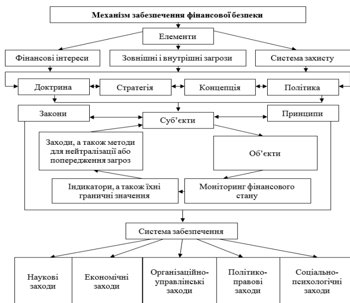
Рис. 1. Механізм забезпечення фінансової безпеки країни

Механізм забезпечення фінансової безпеки має бути реалізований на засадах обґрунтованої фінансової політики у відповідності до прийнятих у встановленому порядку концепцій, доктрин, програм і стратегій у соціальній, політичній, інформаційній, економічній та фінансовій сферах, присутності необхідних суб'єктів забезпечення безпеки, формулювання об'єктів, висвітленні чітких інтересів, класифікації ризиків, використання методів та способів гарантування безпеки (рис. 1).