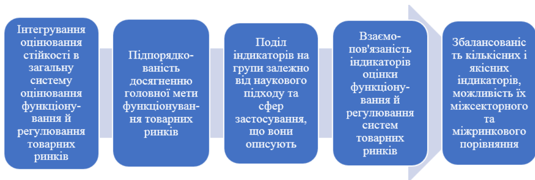
Рис. 1. Принципи вибору індикаторів для оцінювання функціонування товарних ринків у координатах стійкості

Нестабільність зовнішнього середовища обумовлює необхідність впровадження нових вимог до вибору оціночних кількісно-якісних індикаторів. Пропонуємо вибір індикаторів здійснювати відповідно до низки принципів , що дозволяють формувати взаємозв'язки між окремими цілями та показниками функціонування й регулювання товарних ринків (рис. 1).