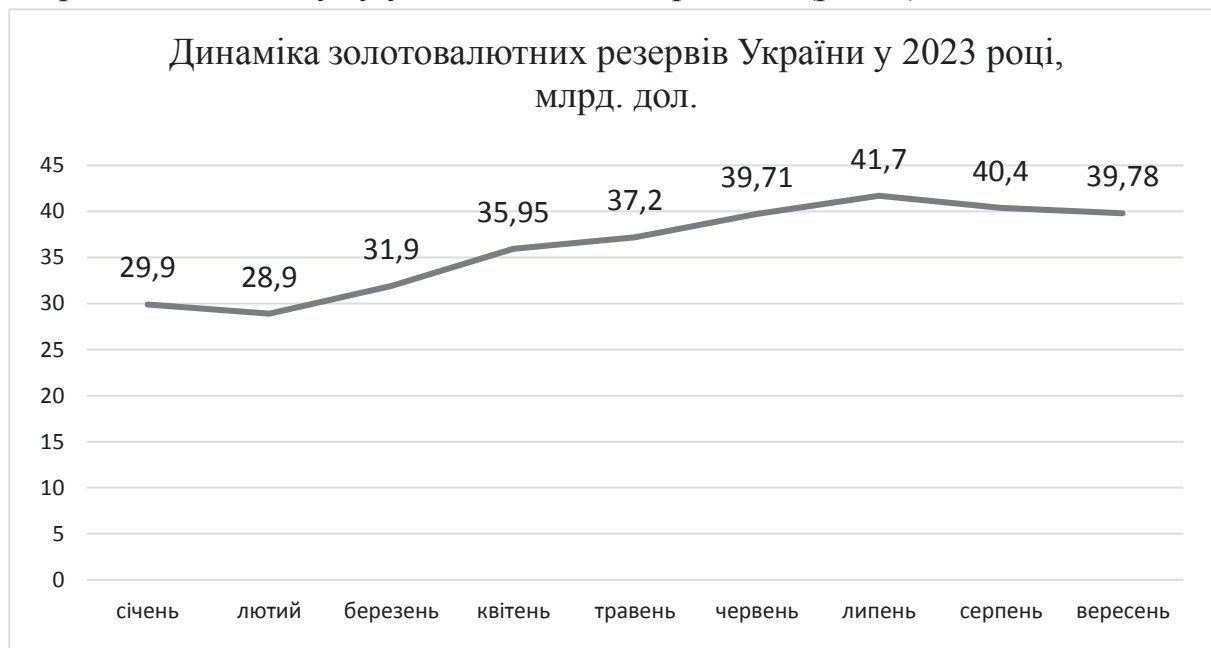
Рис. 2. Динаміка золотовалютних резервів України у 2023 році, млрд.дол.

Фінансова підтримка західних партнерів допомогла Україні сформувати золотовалютні резерви, які вперше у 2023 році досягли історичного максимуму у більш ніж 40 млрд. дол. (рис. 2).