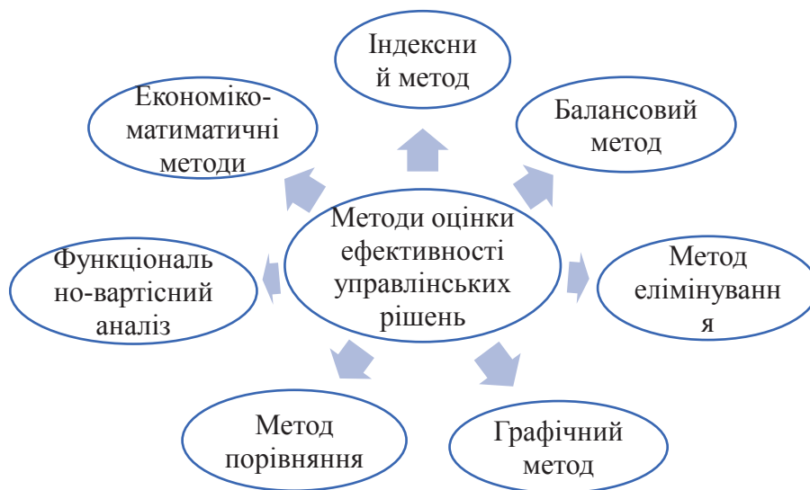
Рис. 1. Методи оцінки ефективності управлінських рішень

У процесі оцінки ефективності управлінських рішень найчастіше застосовується 7 методів (рис. 1) [3]. Проте, застосування для оцінки ефективності управлінських рішень лише одного з розглянутих методів не дасть топ-менеджменту компанії повної картини.