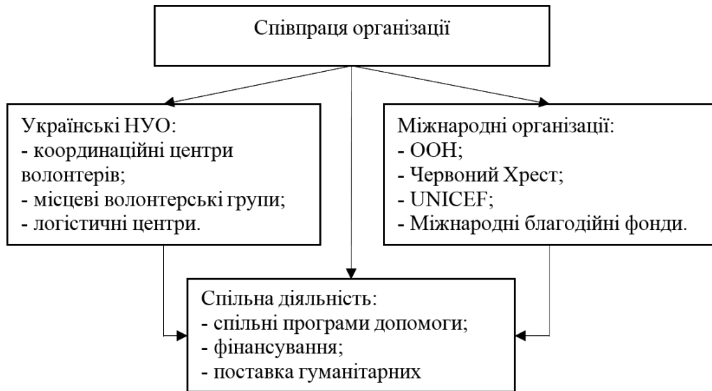
Рис. 2. Модель співпраці українських НУО та міжнародних організацій для координації допомоги