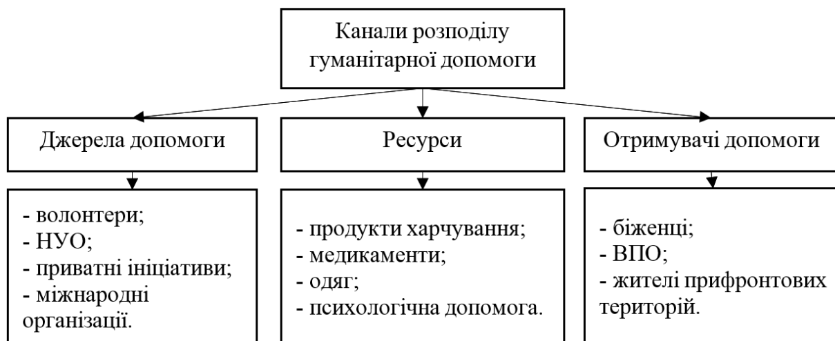
Рис. 1. Схема розподілу гуманітарної допомоги через громадські ініціативи